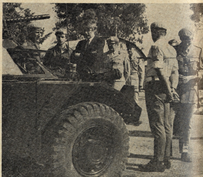
● Mr Ian Gilmour, the British Minister of Defence, is seen talking to members of 'B' Squadron, The Blues and Royals, during his visit to UNFICYP on 25 April 1973.

They mix well and certainly did not show any signs of shyness towards the soldiers from 38 Sqn RCT when they paid a visit to the home recently.