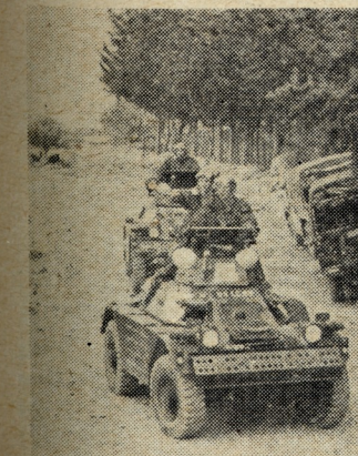
● Force Reserve at an exercise in the Paphos District.